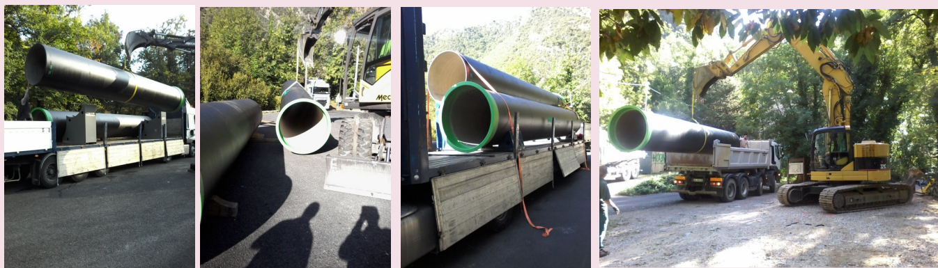
Déchargement des canalisations (Ø1200) destinées au stockage tampon des eaux sales de l'usine sur le parking de Casteil

OCTOBRE 2016 - Travaux de terrassements et pose de réservoirs tampons