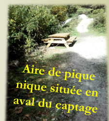
Aire de pique-nique située en aval du captage